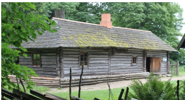
Foto 1. Aarte kaluritalu 19. sajandi lõpust